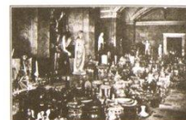
Экспонаты, укрытые в подвалах Эрмитажа

дни прерывалось предостерегающим воем сирен, сигналом воздушной тревоги, и, хотя сплывал приказ об удалении людей по сигналу тревоги из верхних этажей, никто не соглашался уходить в убежища».